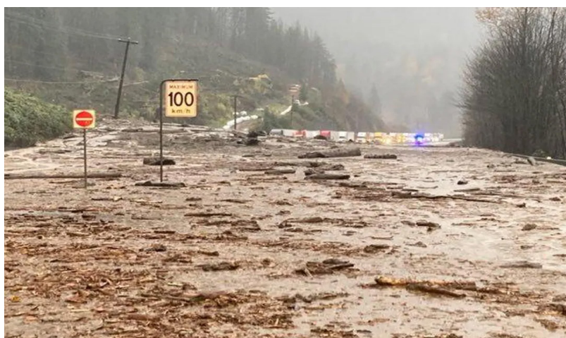
Abbildung 1: Murgang nach den Waldbränden in British Columbia 2021.

In einem Projekt des Bundesamts für Umwelt wurde nach methodischen Ansätzen gesucht, um die möglichen Auswirkungen und potenziellen Schwachstellen klimabedingter kombinierter Extremereignisse zu charakterisieren. In zwei Fallstudien, wurden solche Methoden spezifisch für die Problemstellung von konkreten klimatischen Extremereignissen ausgearbeitet und in verschiedenen Settings erprobt. Die Vorteile und Herausforderungen der angewendeten Methoden werden in diesem Kurzbericht vorgestellt.